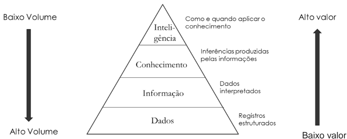
Figura I - Pirâmide do Conhecimento.

Fonte: Elaborada pelo autor-Adaptada de Eleutério (2015) e Rowley (2007).