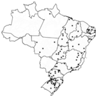
(e) Cluster 5 "Pequenos, mas influentes"