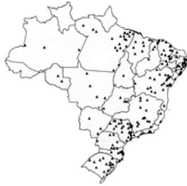
(b) Cluster 2 "Pequenos e pouco criativos"