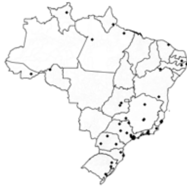
(d) Cluster 4 "Aglomerações muito criativas"