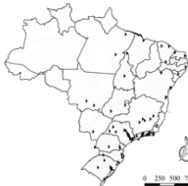
(f) Cluster 6 "Aglomerações criativas"