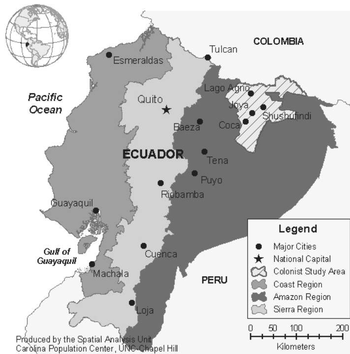
Figura 1_ Área em estudo no Norte da Amazônia equatoriana