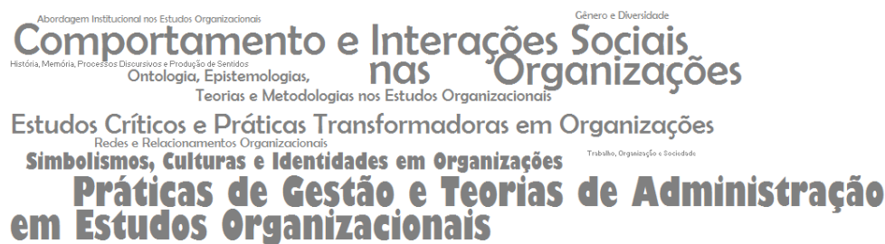
Figura 1 – Nuvem dos temas mais citados nos artigos pesquisados